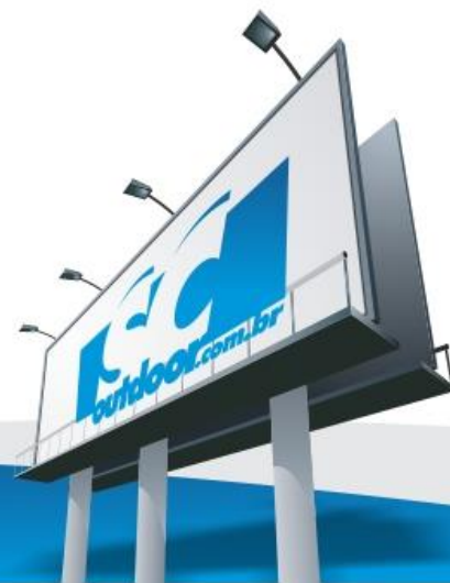
Luana Pivatto SC Outdoor