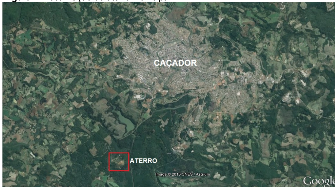
Figura 1- Localização do aterro municipal