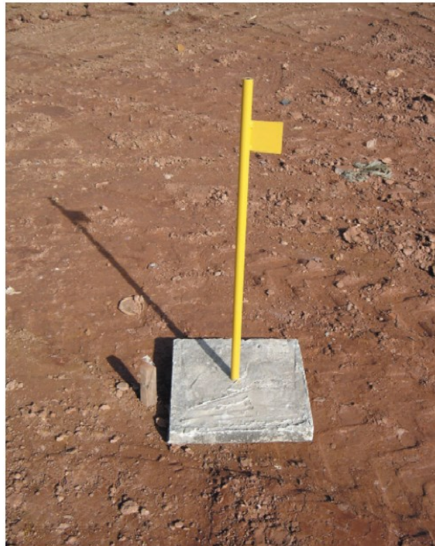
Figura 1 - Marcos superficiais: medidor de recalque de base quadrada