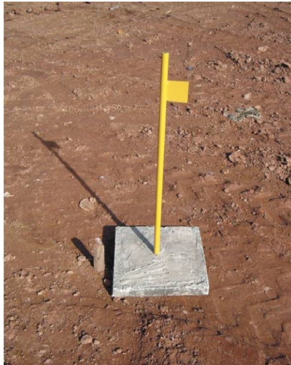
Figura 1 - Marcos superficiais: medidor de recalque de base quadrada