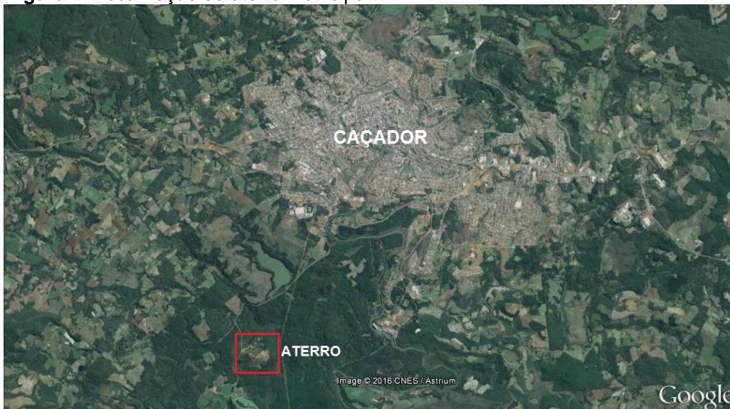
Figura 1- Localização do aterro municipal