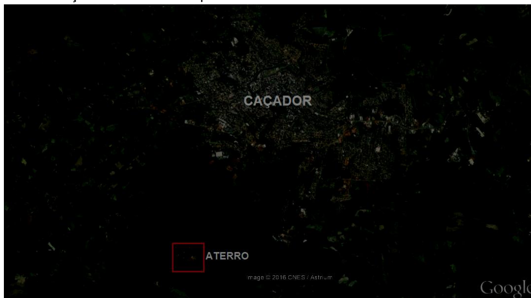
Figura 1- Localização do aterro municipal