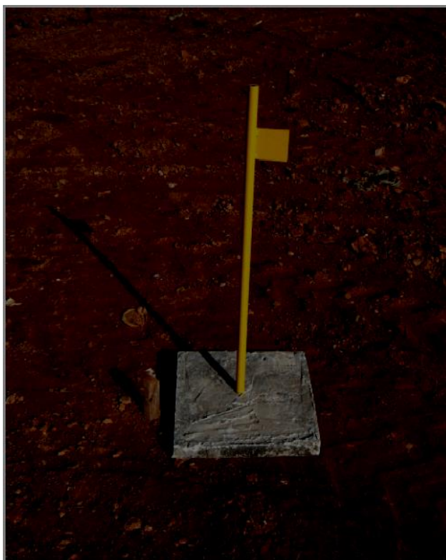
Figura 1 - Marcos superficiais: medidor de recalque de base quadrada

O acompanhamento deve ser feito por meio do registro topográfico das posições de medidores de recalque e marcos superficiais nas superfícies dos taludes, bermas e topo do aterro.